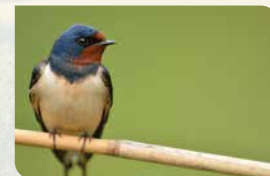
Faunaplan p. 15