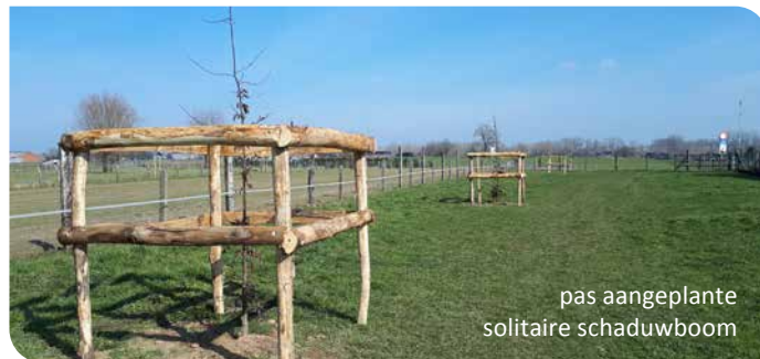
pas aangeplante solitaire schaduwboom

Kruidenrijke gras- en hooilanden zijn niet alleen mooi om te zien, ze zijn ook goed voor de biodiversiteit en voor het paard zelf. Wist je dat een divers, vezelrijk en structuurrijk dieet veel gezonder is voor paarden? Laat dit net de troef zijn van kruidenrijke gras- en hooilanden. Ze bestaan uit een gevarieerd aanbod van bloeiende kruiden en grassen. Met hun lange wortels halen de kruiden kostbare vitamines, mineralen en sporenelementen uit de diepere bodemlagen. Door deze krui-