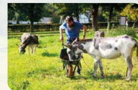
Natuur met zorg p. 4