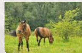
Paard in het Landschap p. 3