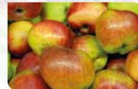
Boomplantactie p. 10