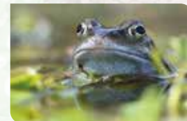
Biodiversiteit in je tuin p. 15